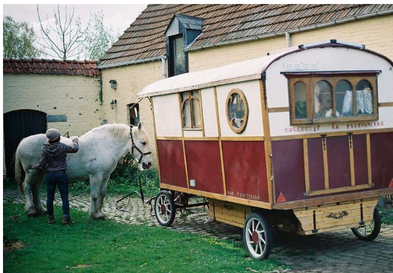
Roulotte hippomobile du Collectif artistique La Pigeonnière

En 2021, grâce à une rencontres avec d'autres artistes et compagnies partageant l'approche de la mobilité douce au sein du réseau ARMODO (Réseau des ARTs à MOdes DOux) - la traction animale fait son entrée dans le champ des possibles.